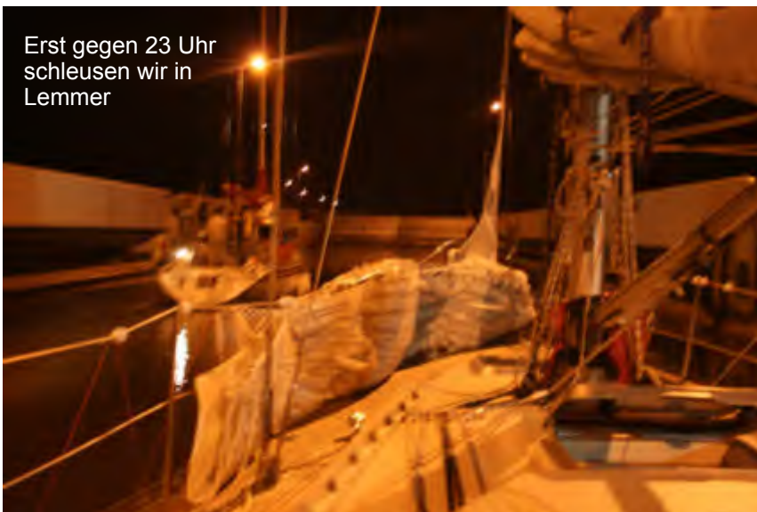
Erst gegen 23 Uhr schleusen wir in Lemmer