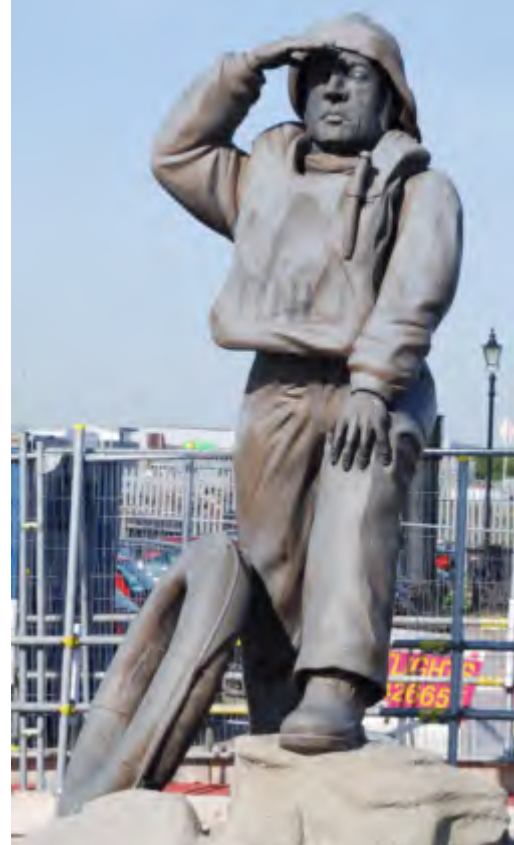
Wir wurden bereits erwartet

„Land in Sicht, Kai!!“, schallt der Skipper durch das Schiff, ich werfe einen Blick auf die Uhr und muss mit Entsetzen feststellen, dass es schon kurz vor Acht Uhr ist. Axel und