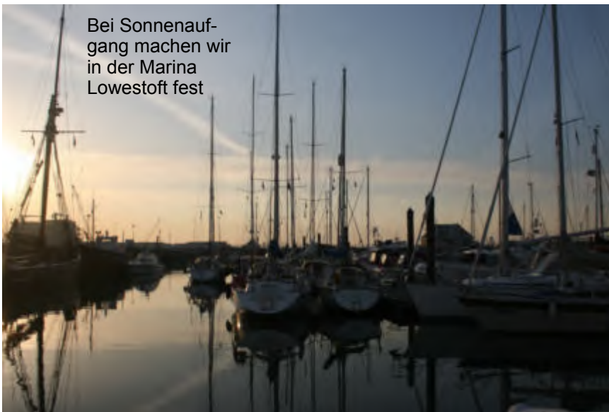
Bei Sonnenaufgang machen wir in der Marina Lowestoft fest

aber auch leicht gieriges Aufatmen und kurz darauf zischt es aus allen Ecken verräterisch und Segelanekdoten machen die Runde. Von kaputten Motoren, Mastbrüchen, Nixen und Klabautern, die Schnaps klauen.